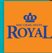
MAC CRAIG Royal Snuff