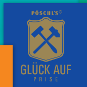
GLÜCK AUF PRISE