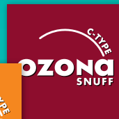
OZONA C-Type Snuff