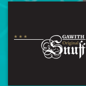
GAWITH Original Snuff