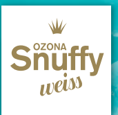
OZONA Snuffy Weiss