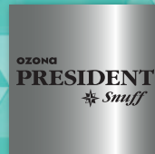
OZONA President Snuff