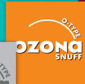
OZONA O-Type Snuff