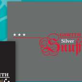
GAWITH Silver Snuff