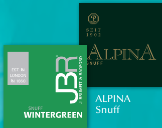
JBR Wintergreen Snuff