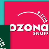
OZONA R-Type Snuff