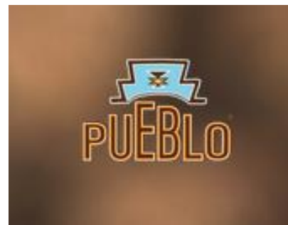
PUEBLO Feinschnitt – 100% ohne Zusatzstoffe