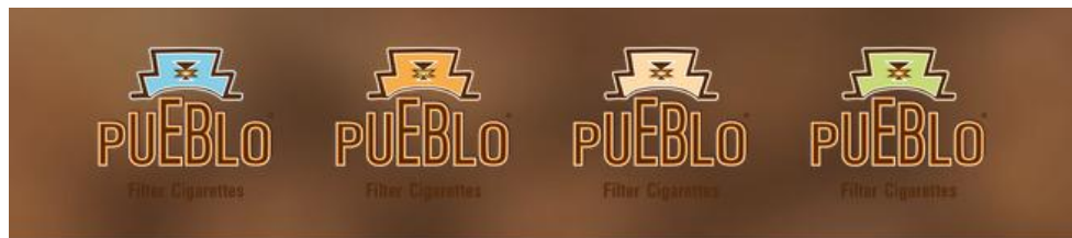
PUEBLO Zigaretten ohne Zusatzstoffe – Classic, Green, Blue und Orange

Das ehemalige Nischensegment „additivfreie Zigaretten“ hat heute bereits eine treue und stetig wachsende Anhängerschaft. Die Käuferschicht zeichnet sich dabei durch qualitätsbewusste Konsumenten aus, bei denen der Genuss, absolutes Qualitätsdenken und Individualität im Vordergrund steht.