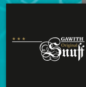
GAWITH Original Snuff