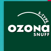
OZONA S-Type Snuff