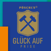
GLÜCK AUF Prise