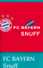
FC BAYERN Snuff