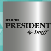
OZONA President Snuff