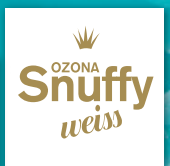
OZONA Snuffy Weiss