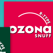
OZONA R-Type Snuff