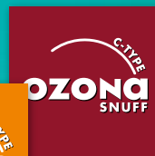
OZONA C-Type Snuff