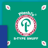
PÖSCHL'S S-Type Snuff