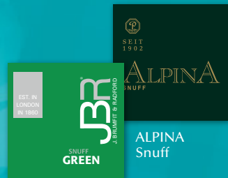
JBR Green Snuff