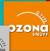
OZONA O-Type Snuff