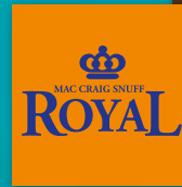
MAC CRAIG Royal Snuff