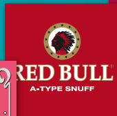
RED BULL A-Type Snuff