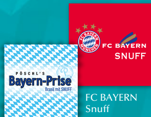
BAYERNPRISE Brasil mit Snuff